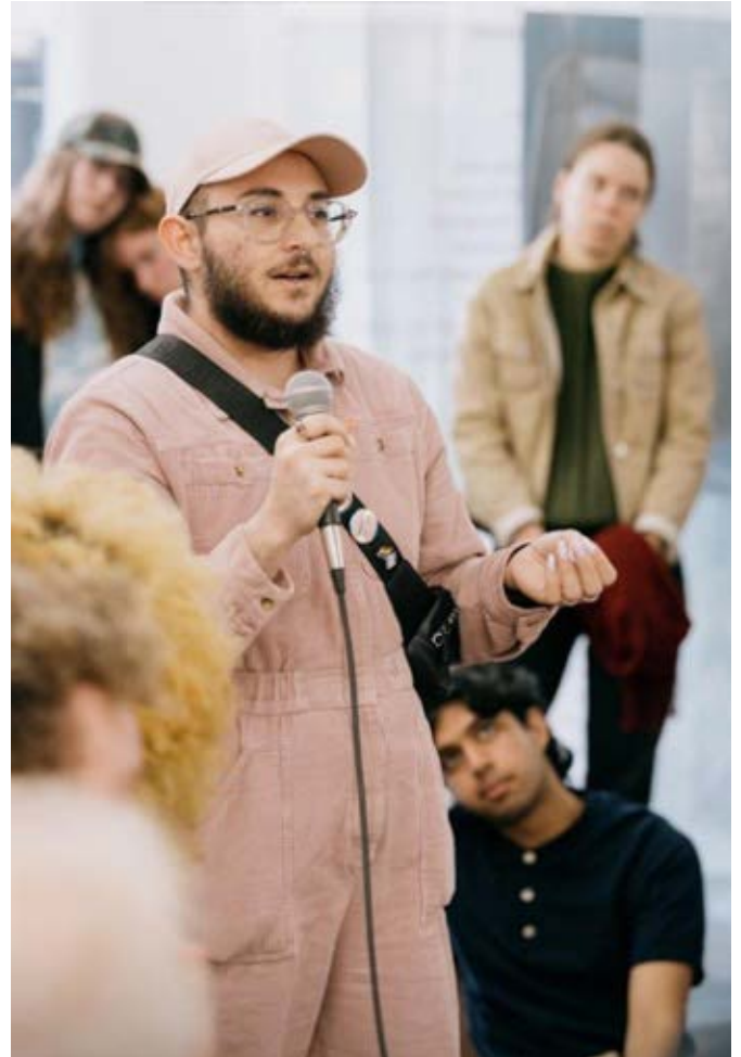
Workshophelg for utdanning av erfaringskonsulenter 2021