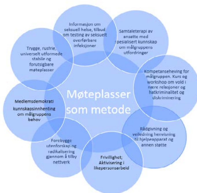
Figur 3: Møteplassene som metode. Figuren illustrerer hvordan våre møteplasser danner et viktig grunnlag for arbeidet vi gjør i Skeiv Verden.

I dag arrangeres vår faste lavterskel møteplass Skeiv Kafe ukentlig i Oslo, annenhver uke i Bergen og Trondheim. I Stavanger og Hamar arrangeres Skeiv Kafe en gang i måneden i samarbeid med Frivillighetssentralen i Stavanger og Fri Innlandet. Alle disse er drevet av frivillige, med støtte fra ansatte i sentralledet som koordinerer frivilligheten og gir faglig støtte til lokallagene for å sikre trygghet, forutsigbarhet og stabilitet. Både i Oslo og Bergen tiltrekker Skeiv Kafe mellom 30 og 40 mennesker fra målgruppen ukentlig i hver av byene.