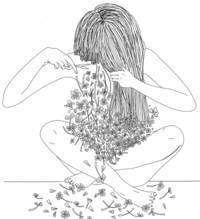
Illustrasjon fra boken "I am what I am"

I am what I am kaster lys på den positive effekten organisasjonen har hatt i livene til våre brukere. Ungdommene deler personlige erfaringer og historier i møte med det norske samfunn som skeiv med innvandringsbakgrunn. Boken fungerer som bindeledd mellom skeive unge og samfunnet utad, og bidrar til økt aksept og toleranse for minoritetsmiljøene vi jobber for. Prosjektet har bidratt til å utvikle et materiale som kan bli en viktig kilde både til innsikt i ungdommenes erfaringer for folk generelt, og til å gi andre skeive ungdommer med minoritetsbakgrunn informasjon om at de ikke er alene. I tillegg kan boken bli et nyttig verktøy for Skeiv Verdens videre arbeid, samt et interessant og holdningsskapende lesestoff for bedre innsikt og forståelse av hvordan det er å være ung og skeiv med minoritetsbakgrunn.