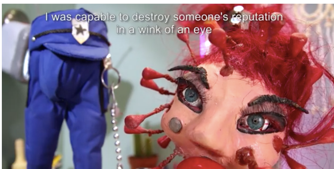
Skjermdump fra "How about HIV/AIDS? Rings any bell?"

Videoene er laget i form av digitale animasjoner basert på illustrasjoner utviklet spesielt for dette prosjektet. Hver del har en varighet på to minutter og formidles på engelsk for å tilgjengeliggjøre innholdet for personer som er nye i Norge. Seriens primærmålgruppe er flerkulturelle, homofile menn over 25 år, som i følge vår statistikk og forskning er spesielt sårbare når det gjelder SOI.