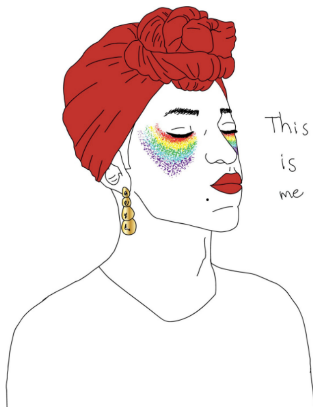
Illustrasjon fra boken "I am what I am"

I 2019 har Skeiv Verdens ungdomsgruppe laget en bok der bokens tekster og illustrasjoner er skapt av ungdommene selv. Boken er gitt ut med støtte fra Integrering- og Mangfoldsdirektoratet. Skeiv Verdens ungdomsgruppe består av personer mellom 14 og 25 år, som treffes jevnlig for å dele erfaringer, bli kjent med andre skeive ungdommer og få støtte når de trenger det. I boken deler de sine historier og sitt arbeid anonymt og står for alle kreative bidrag, utforming av tekst og idéutvikling. Det ble gjennomført workshops der alle beslutninger om bokens utforming, retning og innhold ble avgjort av ungdommene i fellesskap. Formålet med denne prosessen er at ungdommene skal føle økt mestringsfølelse, makt, selvverd og eierskap over egen historieformidling.