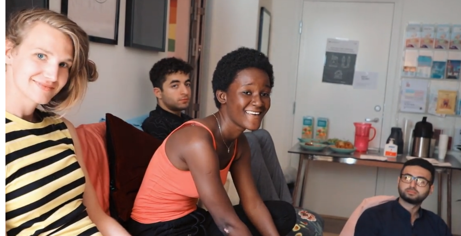
Workshop under pride

Veiledningene har mange ulike temaer. Noen har rett og sett behov for en samtalepartner, andre har behov for praktisk hjelp og informasjon. For noen har det vært behov for stabiliserende samtaler i påvente av offentlig helsehjelp og for noen krisehjelp med å komme i kontakt med riktige hjelpetjenester.