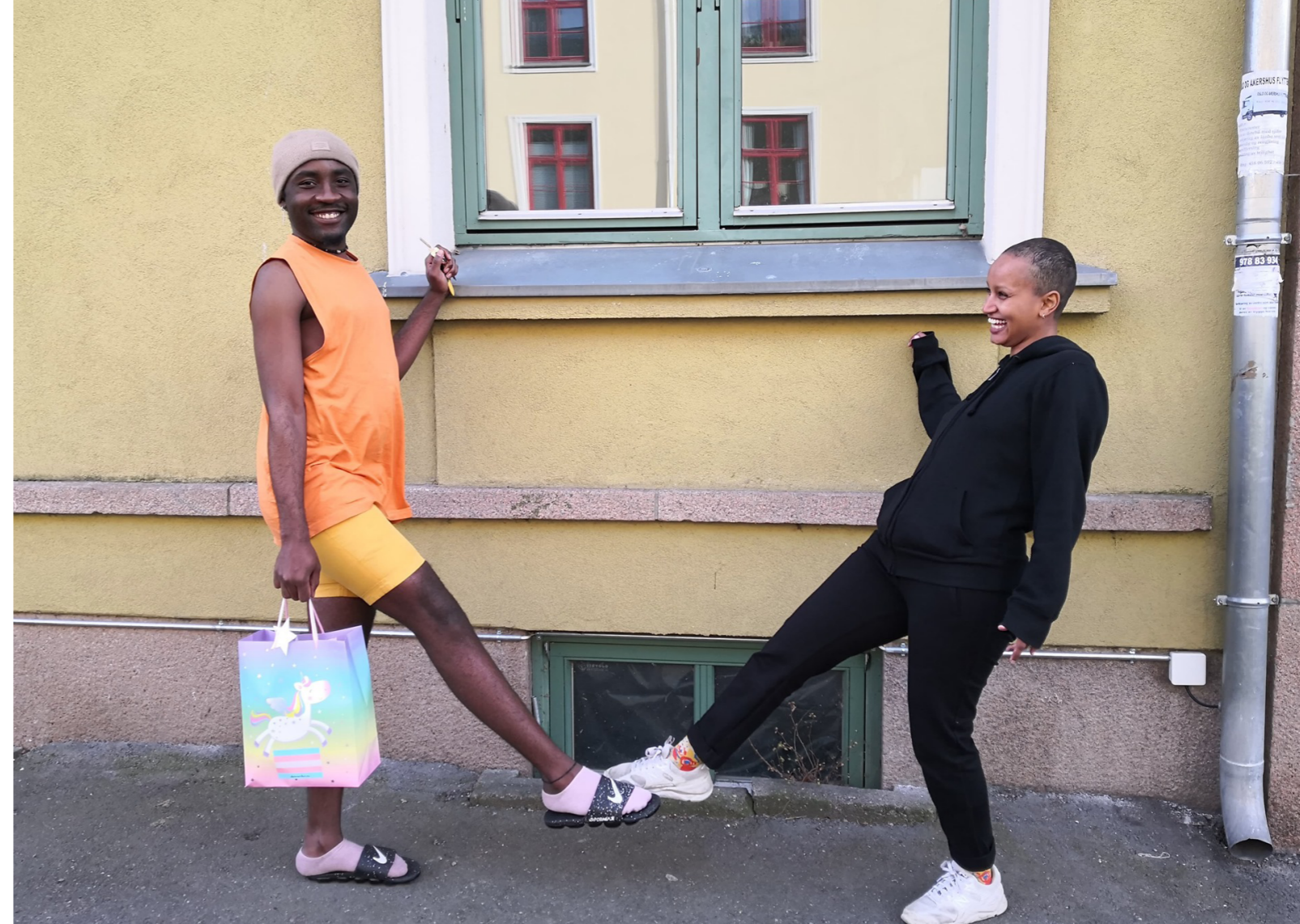
Utlevering av goodie bags til medlemmer

I 2020 har en nylig ansatt prosjektleder begynt arbeidet med kartlegging av behov, samtaler med familier vi er i kontakt med, og ta kontakt med ulike innvandrerorganisasjoner.