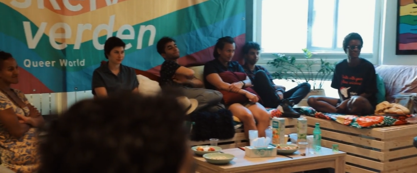
Workshop under pride

håndtere konflikter og situasjoner som oppstår. Dette kan handle om praktisk informasjon, men også psykoedukasjon. Blant Skeiv Verdens målgruppe opplever vi at det er mange som ikke gjenkjenner den vold og negativ sosial kontroll de blir utsatt for som overgrep. På grunn av mange erfaringer med trakassering og vold gjennom livet er vold og undertrykkelse normalisert. Vi jobber i dette prosjektet gjennom samtalegrupper, individuell veiledning og temakvelder med fokus på vold.