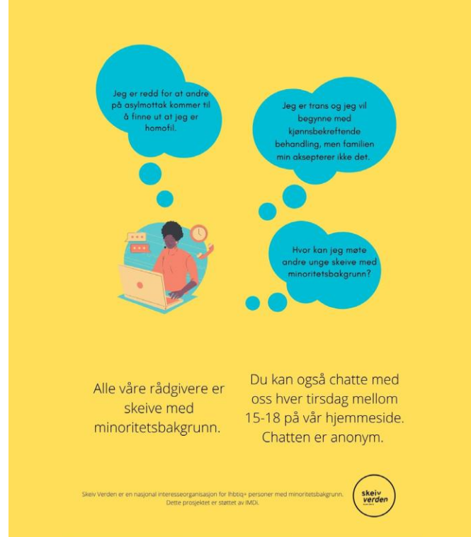
Digital skeiv kafe

Skeiv Verden Oslo og Viken tilbyr vanligvis en regelmessig språkkafe, der det er mulig å øve på norsk i en trygg setting for Skeiv Verdens brukere. Språkaktivitetene har vært noe utfordrende å gjennomføre i 2020 på grunn av restriksjoner for sosiale samlinger. Skeiv Verden Oslo-Viken har derfor ikke fått gjennomført denne aktiviteten i 2020.