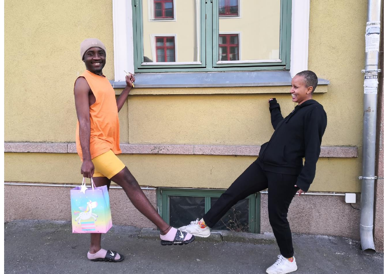
Utlevering av goodie bags til medlemmer

Ved den første lock down så vi behov for å nå ut til våre medlemmer og brukere for å sikre at de hadde god informasjon og vise at vi var der ved behov. Med dette mål informerte vi på facebook om at alle som ønsket ville få smittevernsvennlig besøk med en overraskelsespose til utlevering. Responsen var overveldende og to ansatte i Skeiv Verden fikk en ti timers kjøretur med 27 stopp fra Asker til Mortensrud i Oslo. På treffene fikk de ansatte innblikk i hvordan korona-hverdagen gikk, og svært gode tilbakemeldinger. Vi tror dette var en viktig måte å legge grunnlaget for vårt videre arbeid under korona-restriksjonene, da vi fikk synliggjøre for våre medlemmer og brukere i Skeiv Verden at vi virkelig er der og bryr oss.