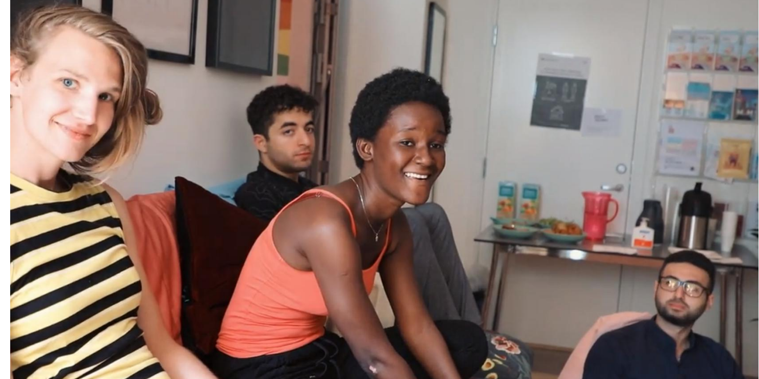
Workshop under pride

Veiledningene har mange ulike temaer. Noen har rett og slett behov for en samtalepartner, andre har behov for praktisk hjelp og informasjon. For noen har det vært behov for stabiliserende samtaler i på-vente av offentlig helsehjelp og for noen krisehjelp med å komme i kontakt med riktige hjelpetjenester.