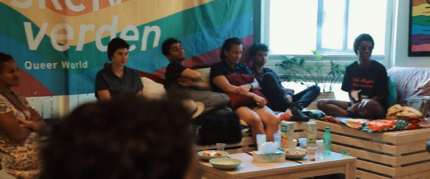
Workshop under pride