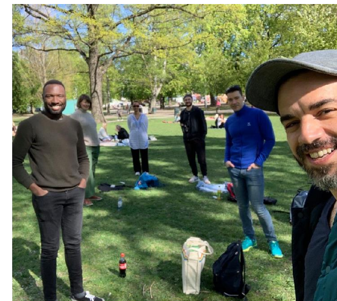
Digital skeiv kafe