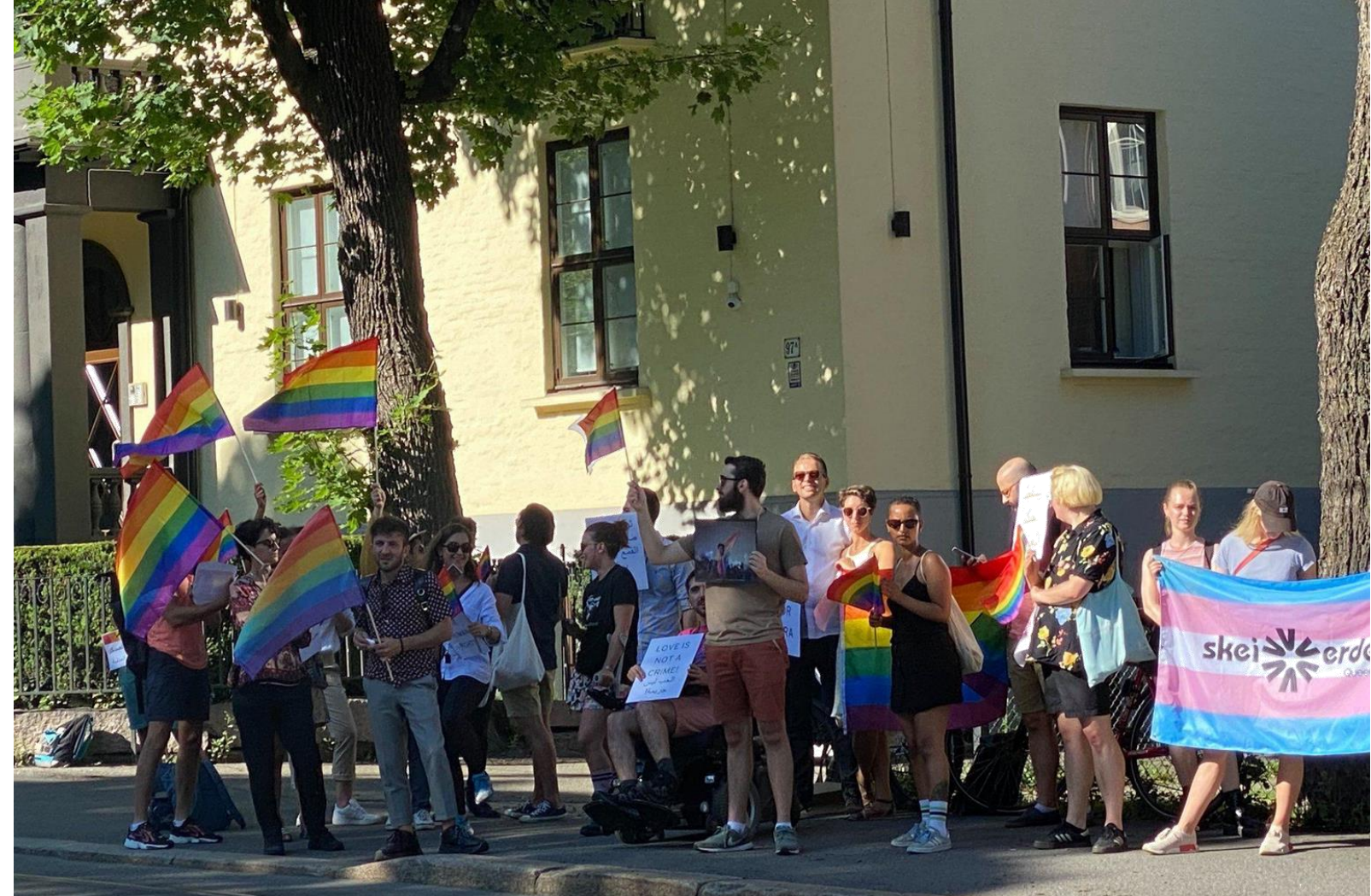
Markering foran Egypts ambassade